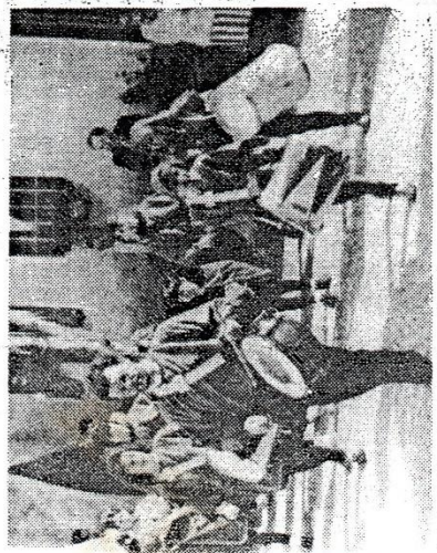
sfilata dei tamburini

Mai vista tanta gente come ieri. La giornata conclusa con il palio delle botti